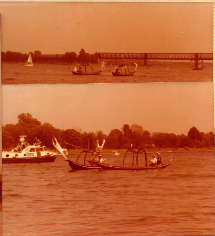
Auf dem Johannisfest: